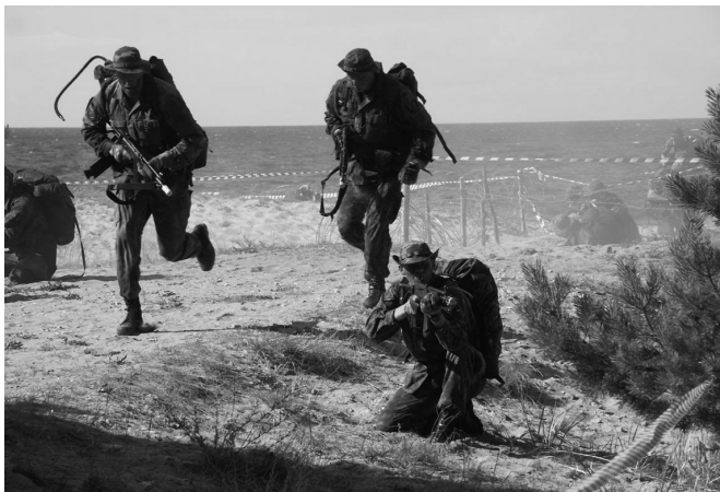
Учения «Эрна» в Эстонии, 2005 г.

Русофобия стала самоцелью страны, ее политической программой и «доказательством» верности эстонцев своей «независимости». Характерно, что Департамент языка Эстонии — или, как его еще называют, языковая инспекция, — не остановился на закрытии в республике всех русскоязычных школ. Теперь это государственное учреждение занимается даже домофонами. Из обращения стали изымать русифицированные аппараты. По мнению чиновников, надписи на языке «страны-агрессора» могут угрожать безопасности Эстонской Республики!