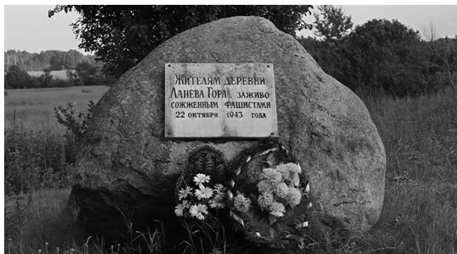
Памятник жителям деревни Ланева Гора