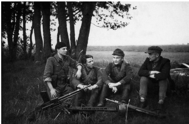
Литовские «лесные братья», 1946 г.

рилось в директиве одного из бандитских отрядов, выпущенной в период подготовки к выборам в Верховный Совет СССР в 1946 г. К сочувствующим коммунистам относились с особой жестокостью — вырезали на телах жертв звезды, снимали со спин полосы кожи, заворачивали людей в колючую проволоку, бросали в колодцы, сжигали.