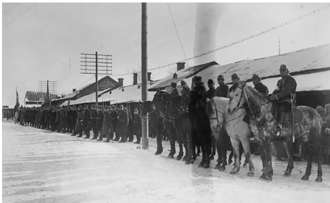
«Кайтселийт», фото межвоенного периода

После переворота 1934 г. новый авторитарный профашистский режим активно взаимодействовал в экономическом, политическом и культурном плане с нацистской Германией. К 1939 г. на территории Эстонии насчитывалось до 160 немецких обществ и союзов, которые занимались пропагандой и агитацией идей национал-социализма. Поэтому не стоит удивляться, что с началом новой германской оккупации Эстонии летом 1941 г. многие ее граждане стали пособниками Третьего рейха.