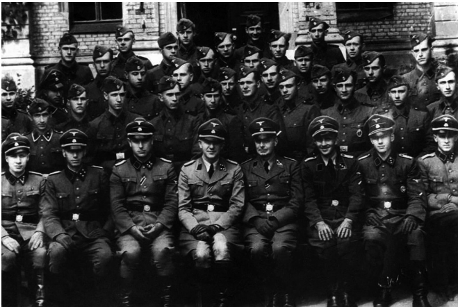
«Команда Арайса» в школе Службы безопасности рейхсфюрера СС. Фюрстенберг, 1942 г.

Местные латвийские коллаборационисты с охотой шли на службу к немецким нацистам и приняли активное участие в «решении еврейского вопроса» — то есть в массовых убийствах евреев. Эти зверства сопровождались грабежами, издевательствами и откровенным садизмом по отношению к жертвам.