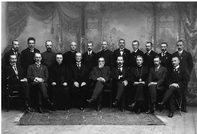
Литовская Тариба, 1917 г.

По Конституции Литвы ее президент избирался Сеймом, вся исполнительная власть сосредотачивалась в правительстве во главе с премьер-министром, которого назначал президент. Такая парламентская система («сеймократия») была крайне нестабильна: с 1918 по 1926 г. в стране сменилось 11 правительств. В 1926 г. в Литве произошел военный переворот, приведший к власти лидера националистов А. Сметону. Он и подручный ему Литовский национальный союз оставались у власти до 1940 г. Такой режим современники справедливо относили к диктаторскому. Стремление литовского руководства подчинить себе все стороны общественной, политической и экономической жизни делали его откровенно профашистским. В 1940 г., после вхождения Литвы в состав СССР, Сметона бежал за границу, в Германию, потом в США, где и погиб при пожаре в своем доме в 1944 г.