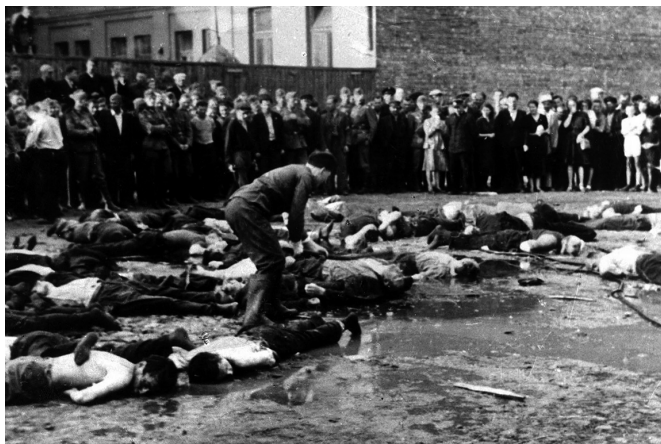
Горожане Каунаса и немецкие солдаты наблюдают за расправой над евреями в ходе погрома, 1941 г.