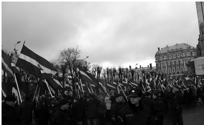
Празднование Дня памяти латышских легионеров, 2008 г.

в тылу немецких войск «наводили порядок» два латвийских полицейских батальона.