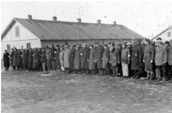
Переключка узников концлагеря Саласпилс, 1941 г.

ли из детского барака окоченевшие трупы. Их сбрасывали в выгребные ямы или сжигали за оградой лагеря. Суточное пропитание детей составляло 100 граммов хлеба и полтора литра жидкости, выдаваемой за суп. Из каждого маленького человека раз в два дня выкачивали до 500 миллилитров крови.