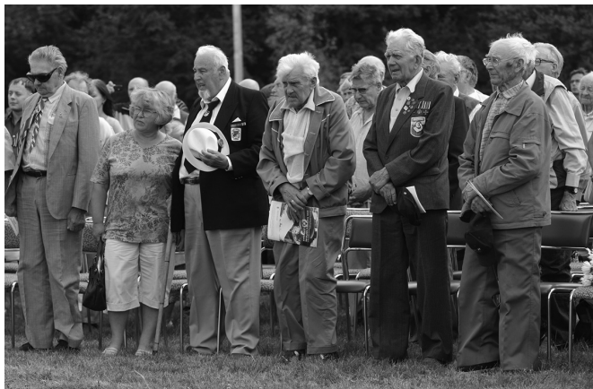
Сбор ветеранов 20-й гренадерской дивизии СС в Эстонии, 2016 г.

инициаторы данной акции предполагали установить памятник в виде человека в эсэсовской форме с автоматом, направленным на восток... Но затем, видимо, испугавшись критики антифашистов на Западе, скорректировали проект.