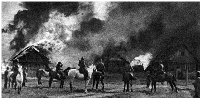
Сожжение деревни «командой Арайса», 1942 г.