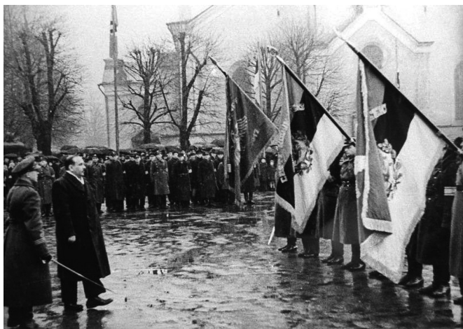
Парад членов организации «Омакайтсе» в Таллине, 1944 г.