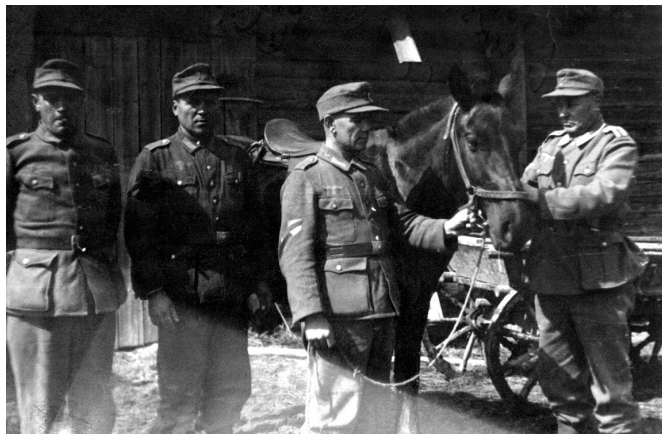
Солдаты эстонского легиона СС в латвийском Цесисе, 1944 г.

подразделения. Ее общая численность была доведена до 15 тыс. человек. Изначально она использовалась для борьбы против партизан и расправ с мирными жителями. Но летом 1944 г. дивизию бросили на ликвидацию прорыва Красной армии под Нарвой. Убивать безоружных людей эстонские эсэсовцы научились хорошо, но воевать против регулярных советских частей они толком не умели. Понеся тяжелые потери, дивизия была отведена в Германию, а в 1945 г. вела бои в Восточной Пруссии, в районе р. Эльбы и в Чехословакии, где и была окончательно разгромлена.