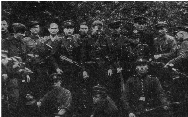
Отряд «лесных братьев» неподалеку от Каунаса, 1946 г.