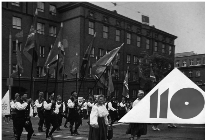
Шествие в честь XIX всеэстонского праздника песни и танца в Таллине, 1980 г.

После 1945 г. значительный рост отмечался в рыбной промышленности республики. До войны эстонские рыбаки добывали в лучшем случае 20 тыс. т рыбы в год, а океанский рыбный промысел почти отсутствовал. В Эстонской ССР в год в прибрежных водах вылавливали от 60 тыс. до 90 тыс. т рыбы, а океанский улов мог приносить более 350 тыс. т.