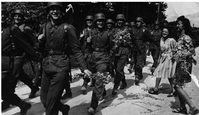
Проводы Латышского легиона СС