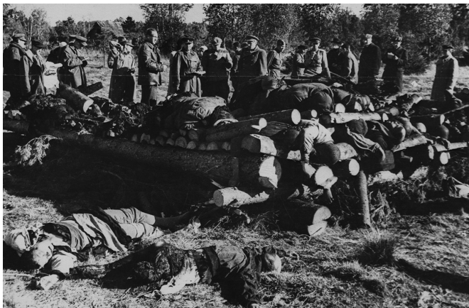
Тела, найденные в концентрационном лагере Клоога после его освобождения Красной армией, 1944 г.

ветские военнопленные, литовские евреи, политзаключенные и интернированные граждане. Лагерь оставался одним из последних действовавших в системе Вайвары.