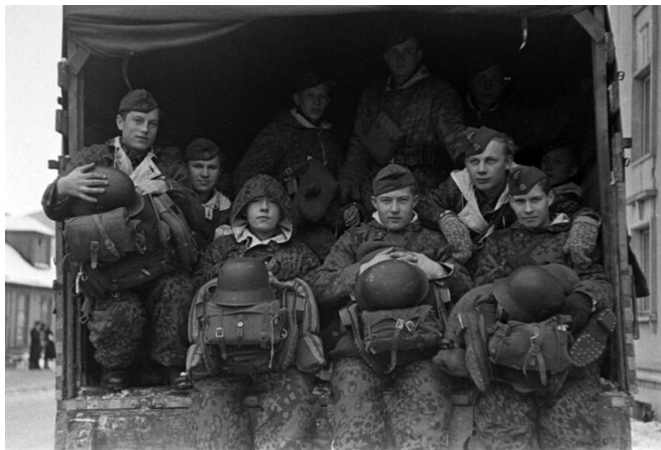
Эстонские легионеры СС, 1944 г.

Как свидетельствуют документы немецкого командования, 3-я эстонская добровольческая бригада СС вместе с другими подразделениями немецкой армии проводила в октябре — декабре 1943 г. карательные операции по ликвидации советских партизан в районе Невель — Идрица — Себеж. К эстонским эсэсовцам примкнули также полицейские батальоны. Они участвовали в боях с партизанами, расстрелах населения, грабежах, уничтожении целых деревень в РСФСР и Белоруссии, массовой отправке мирных граждан в Германию.