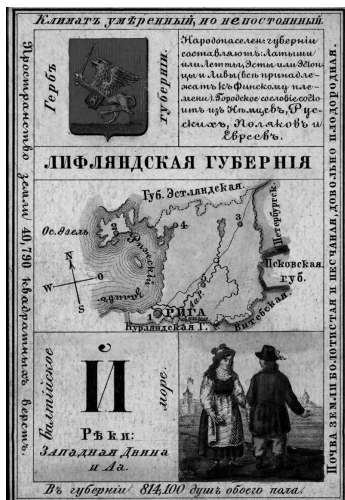
Лифляндская губерния. Карточка из набора географических карт Российской империи, 1856 г.