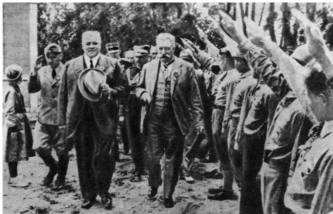
Члены молодежной латвийской организации «Мазпулки» приветствуют Карла Ульманиса, 1937 г.

пущен, запрещались профсоюзы и общественные организации. Программа диктатора мало чем отличалась от доктрины Гитлера в Германии, о чем заявляла Компартия Латвии: «фашистская диктатура Ульманиса под флагом народной власти выдвигает программу „возрождения государства“, заимствованную у Гитлера».