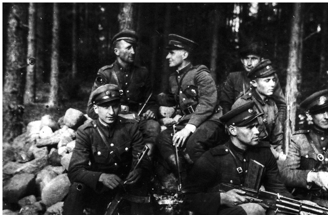
Литовские «лесные братья» в окрестностях Игналины, 1949 г.

«советскими оккупантами». Правительство ведет целенаправленную политику по героизации литовских бандитов и пособников нацистов. В честь них устанавливают памятники, называют улицы. Бывшие члены террористического подполья регулярно получали премии от парламента и правительства Литвы.