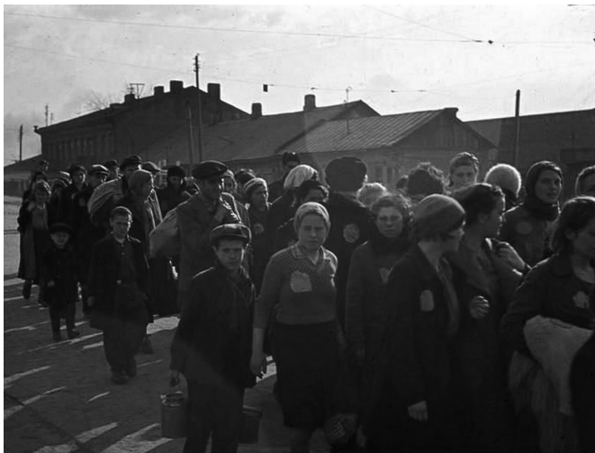
Колонна узников Минского гетто в лагере, 1941 г.

ради привлечения его в шахматную сборную закрыло глаза на его преступления. Так, виновный в убийствах тысяч мирных граждан благополучно жил под покровительством местных властей. Умер в Мельбурне в 88-летнем возрасте.